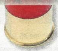
Riffaut Chasse Étoile