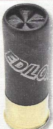
Édiloisir Chasse 36 BJ

• B&P (BCL Distribution): 05.53.58.32.51.