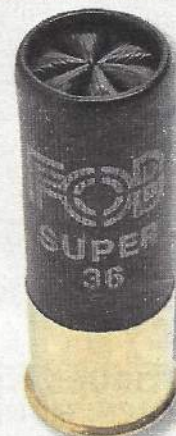
Fob Super 36