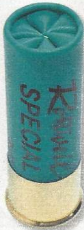
Rottweil Spécial 36