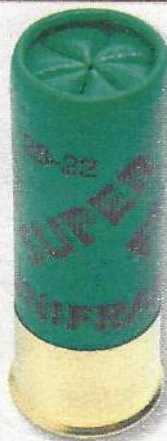
Unifrance Super Frap