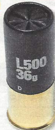
Solognac L500 36G