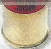
Jocker Performance 36