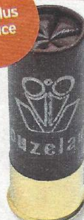
Vouzelaud Super Atout