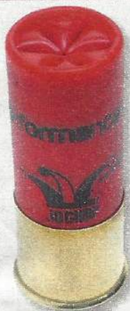
Jocker Performance 36