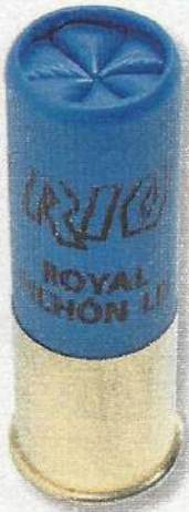
Rio Royal Pichon LD