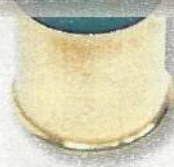
Remington Shurshot 36 BJ