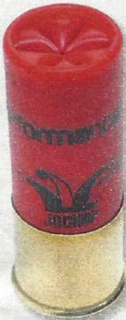
Jocker Performance 36

• Sauvagine (Nantes Armes): 02.40.47.76.74.