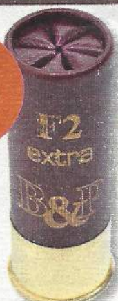
B&P F2 Extra