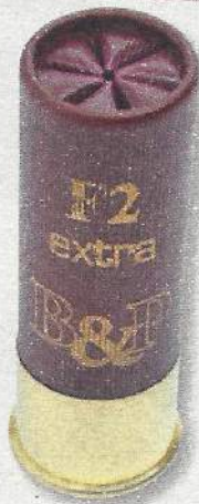
1 re B&P F2 Extra