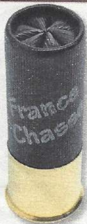
Tunet France Chasse