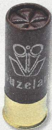
2 e Vouzelaud Super Atout