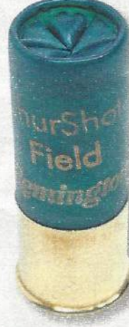
Remington Shurshot 36 BJ