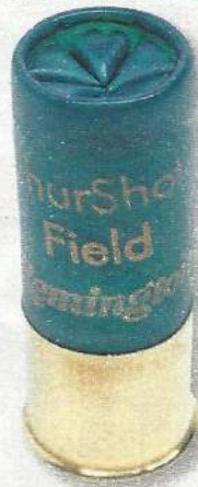
Remington Shurshot 36 BJ