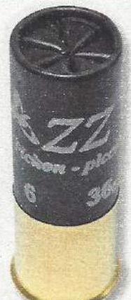
Winchester ZZ Pigeon