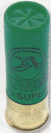
Sauvagine Super 70