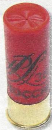
Fiocchi PL 36 HP