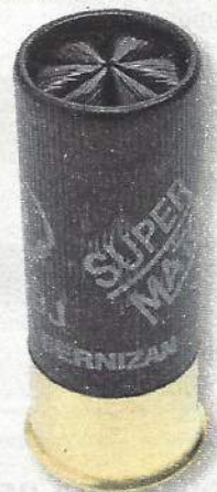
Super Match Noire BJ