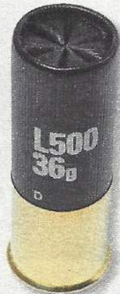
3 e Solognac L500 36G