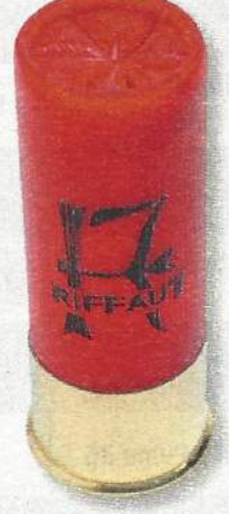
Riffaut Chasse Étoile