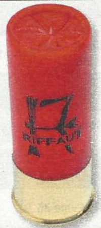
Riffaut Chasse Étoile